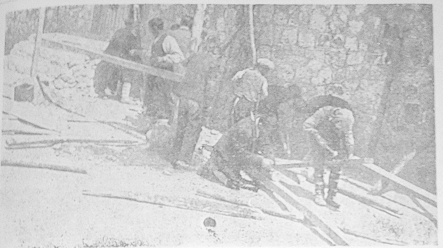
Köy okulunda öğrenciler sahne yaparlarken

8) Kapı kilitleri yüksekliği birinci sınıf için 90, diğer sınıflar için 100 cm. olmalıdır.