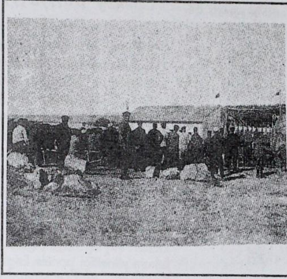
Eğitmen namzetleri Mahmudiye köyünde Yarım Osman ve Çoban piyeslerini temsil ediyor.