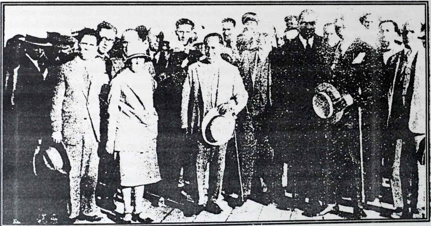
Gazi Eğitim Enstitüsünün Ankara'da temel atma töreni.

Son bir ödev daha vardır. Bu okul binası, değerli bir mimarın elinden çıkan bir plânla koruluyor. Yazık ki, bu mimar, şimdi aramızda yoktur. Kemalettin merhumun adını burada saygı ile anmak da bize düşen bir borçtur.” 6