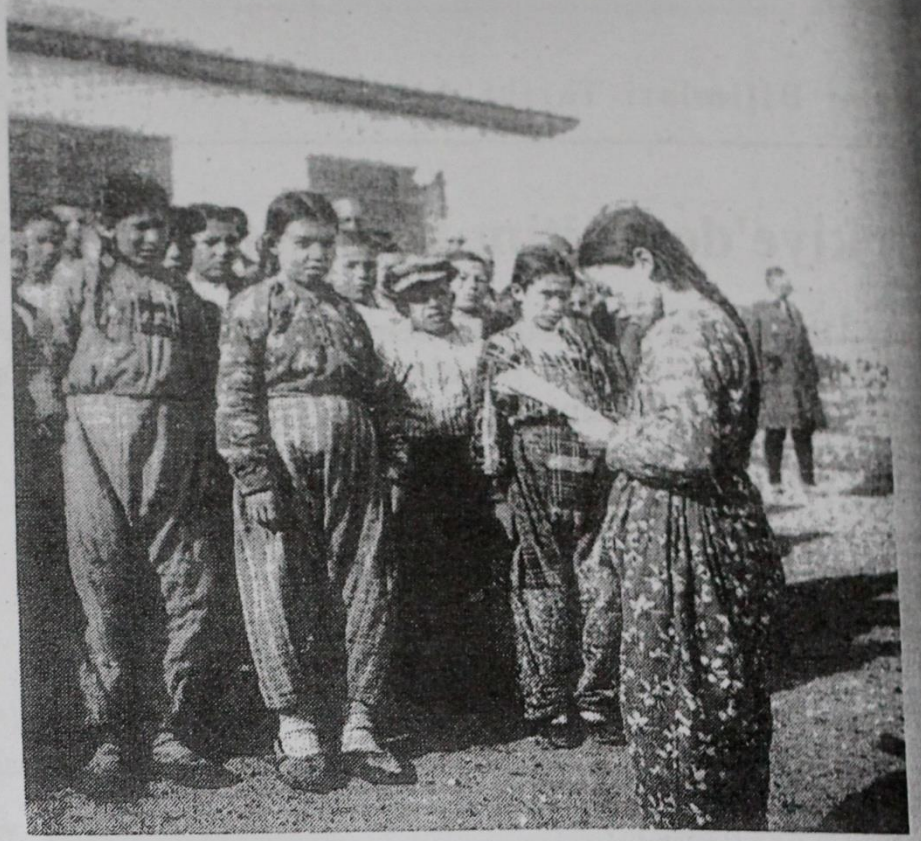
Köy kızlarının yetiştirilmesi üzerinde önemle durulmuştur

Saffet Arıkan'ın Bakanlığı döneminde kurulan köy öğretmen okullarının açılmasıyla, aynı amaca yönelik başka okulların da açıldığı görülmektedir. Hasan Âli Yücel'in bakanlığı döneminde açılan köy